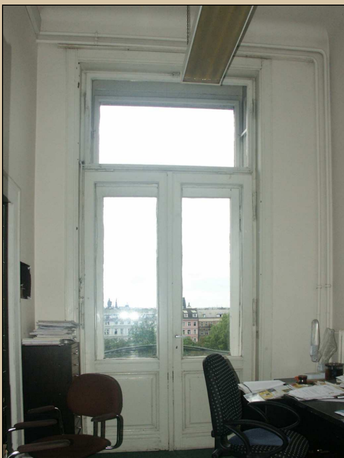
vnitřní líc dveřního křídla