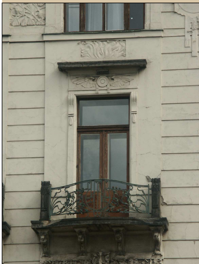
vnější líc dveřního křídla

NÁVRH: zachovat na původním místě, repasovat, v případě dochování původního nátěru tento restaurátorsky opravit nebo provést nový dle analogií v objektu (zřejmě fládr); zachovat původní či historické kování, chybějící původní kování doplnit přesnými kopiemi, natřít zapuštěné závěsy (viz stávající stav) Obnovit původní barevnost podle průzkumu barevnosti oken. Z interiéru obnovit bílý nátěr, z exteriéru obnovit povrchovou úpravu, shodnou jako u již rekonstruované části C. Viz technologický postup TP/118.