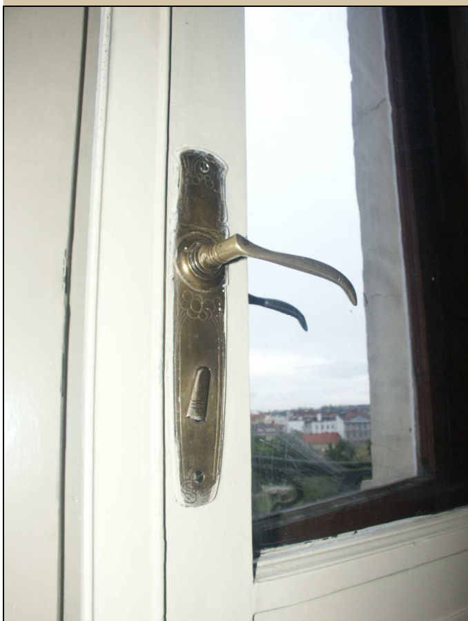
klika se štítkem