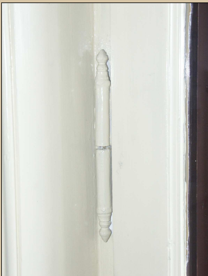
zapuštěný dveřní závěs